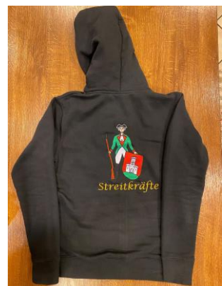
HOODIE-JACKE ROT od. SCHWARZ DAMEN/HERREN 45 Euro